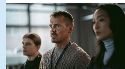
Jasper Pääkkönen tähdittää Ruudun uutta suomalais-japanilaista alkuperäissarjaa Tokio-Tampere . Uutuussarjassa yhdistyvät suomalaisen rikosdraaman intensiteetti ja japanilaisen jännärin kiehtovuus. Tokio-Tampere-sarjan pääosissa nähdään Pääkkösen lisäksi Anne Watanabe. Watanabe on yksi Japanin suurimmista tähdistä. USA on tuonut näyttävyyttä näyttelijä-mallin ja